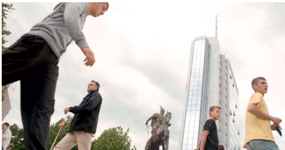
ПРИШТИНА: ОСУДЕ ЕУ ЗБОГ КРШЕЊА ЉУДСКИХ ПРАВА ОВДЕ НИКОГА НЕ БРИНУ